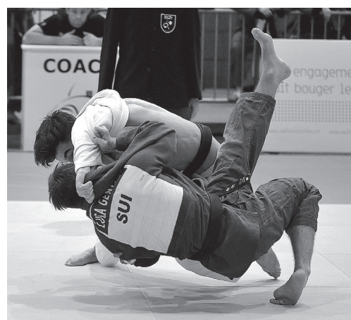
Le Judo-Club Cheseaux

Ainsi, ces Championnats Suisses 2016 se terminent pour le Judo-Club Cheseaux avec trois médailles de bronze et trois 5 e places. Un solide résultat d'ensemble.