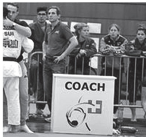
dans les bras de son coach